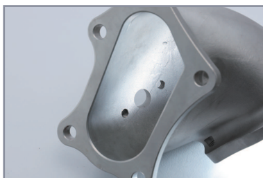
ワイドマウス設計

ターボチャージャーからの排気ガスと バイパスポートからの排気を しっかり受け止め、スムーズに集合させて フロントパイプへと流します。