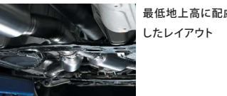
最低地上高に配慮したレイアウト