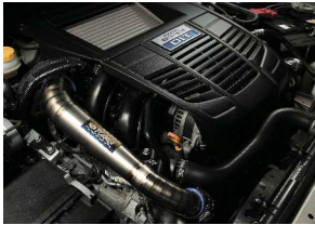
エンジンルームを美しく演出

純正の樹脂製インレットパイプをチタン製にすることで重量を抑え、強度アップを実現。パイプの段差や凹みを無くしスムーズにタービンで圧縮された空気が流れ、性能の向上を果たします。また、エンジンルームのアクセントとしてもチタンの輝きを放ちます。