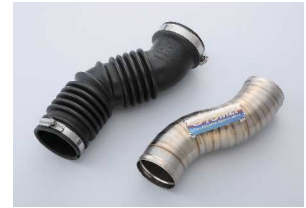
純正の蛇腹を廃したレイアウト