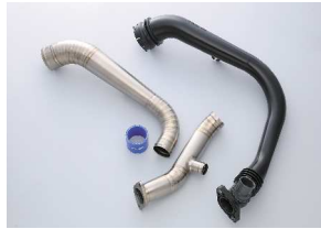
純正のパイプ段差などをなくし、よりスムーズな吸入効率となるレイアウト