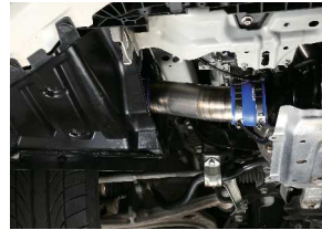
参考：取り付け位置

タービン入り口の蛇腹ホースをチタン製インレットパイプに交換することで吸気抵抗を低減。ターボチャージャーの性能向上を果たすターボサクションパイプです。