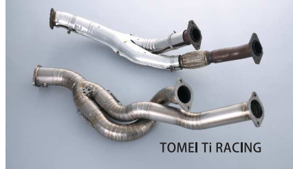
TOMEI Ti RACING