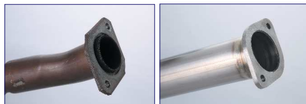
触媒側比較 (左:BNR34純正 右:TOMEI)