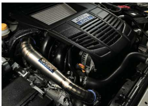
エンジンルームを美しく演出

純正の樹脂製インレットパイプをチタン製にすることで重量を抑え、強度アップを実現。パイプの段差や凹みを無くしスムーズにタービンで圧縮された空気が流れ、性能の向上を果たします。また、エンジンルームのアクセントとしてもチタンの輝きを放ちます。