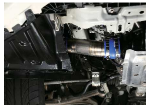
参考：取り付け位置

タービン入り口の蛇腹ホースをチタン製インレットパイプに交換することで吸気抵抗を低減。ターボチャージャーの性能向上を果たすターボサクションパイプです。