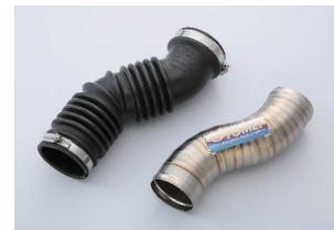
純正の蛇腹を廃したレイアウト