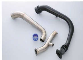
純正のパイプ段差などをなくし、よりスムーズな吸入効率となるレイアウト