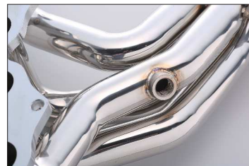
ロストワックス+削出しによる一体成型により、フランジの精度と強度を向上。O2センサーボス完備。

※本品は競技専用部品の為、第1触媒を取り外すレイアウトとなります。 触媒を外した事によりエンジンチェックランプ点灯の可能性があります。本品には対策品は付属されておりませんので、点灯の際はECUリセッティング等で対処するようお願いいたします。