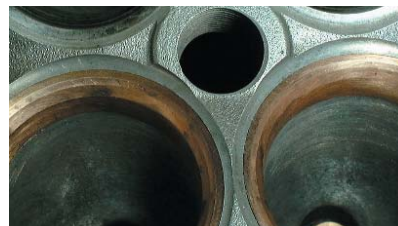
▲ ベリリウムシートリング組み込み写真 TOMEIテストでは、500馬力仕様エンジンにて非常に過酷な状態でテストを実施。クラックは皆無。