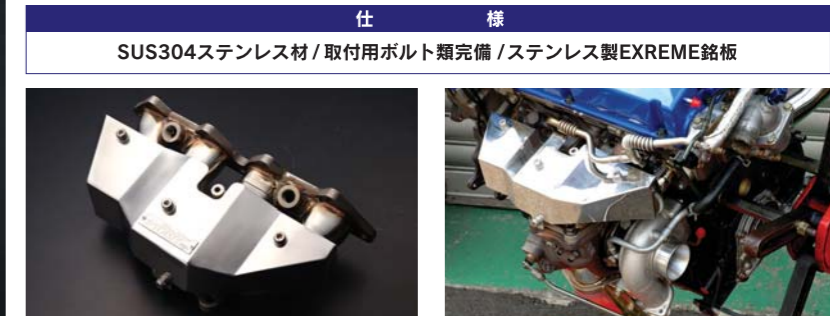
エキマニに装着されているヒートサポートボスにより装着が容易に行えます。(MITSUBISHI純正遮熱板装着可能)

同時発売のヒートプロテクターは、単体で純正エキゾーストマニホールドでも使用できます。