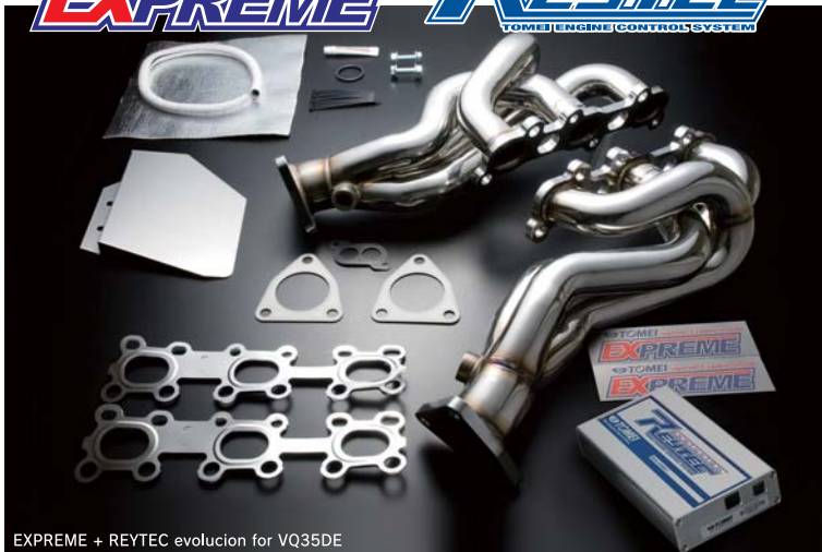
EXPREME + REYTEC evolution for VQ35DE