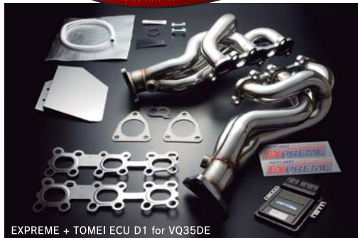
EXPREME + TOMEI ECU D1 for VQ35DE